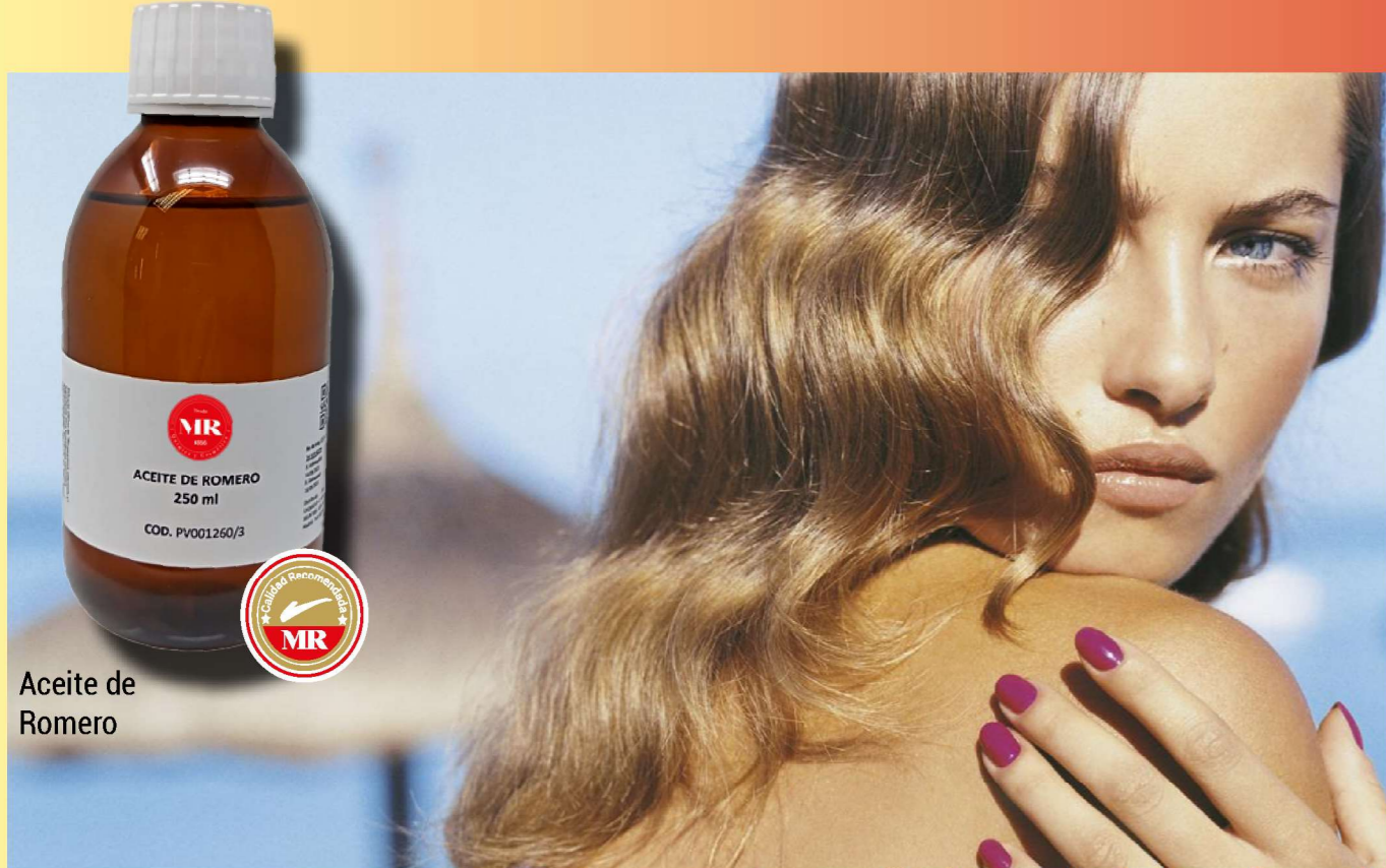
Aceite de Romero