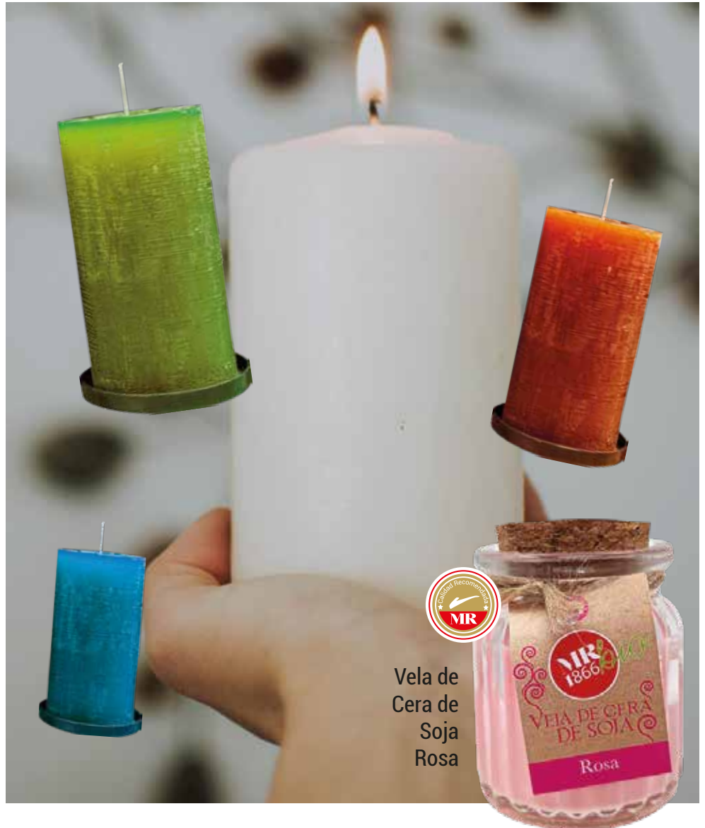
Vela de Cera de Soja Rosa