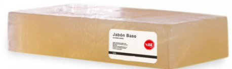
Jabón base glicerina barra

50 ml = 5,45 € 100 ml = 8,23 € 1 L = 60,38 €