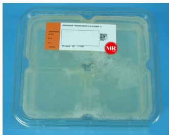
Jabón base transparente glicerina