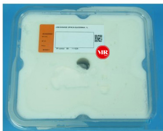
Jabón base opaca glicerina